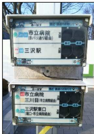
停留所表示機 (停留所名：市役所・公会堂前②ほか)