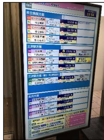
待合室情報ディスプレイ (市立三沢病院ほか)