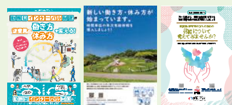
各制度に関するリーフレット(例)

「勤務間インターバル制度」「犯罪被害者等の被害回復のための休暇」「時間単位の年次有給休暇」「特別な休暇制度」などについて、企業の取組事例の紹介や、リーフレットなどの資料を掲載しています。