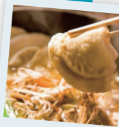
なんでも美味しい〜