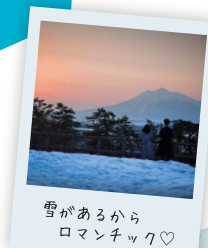
雪があるから ロマンチック♡